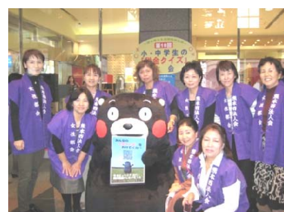
「税金クイズ大会」には、 スタッフとして参加。 くまモンと記念撮影♥