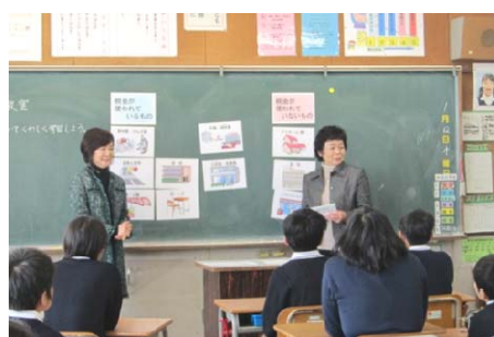
「租税教室」開催しました。 小学生の皆さんと税について学習 しました。