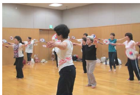
「太極柔力球」初挑戦！ 楽しく汗をかきました♪